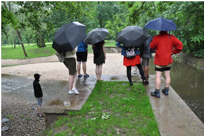
Jarní vycházka do parku Střelnice, 14.6. 2020

Vyúčtování projektů a plánování akcí v roce 2021.