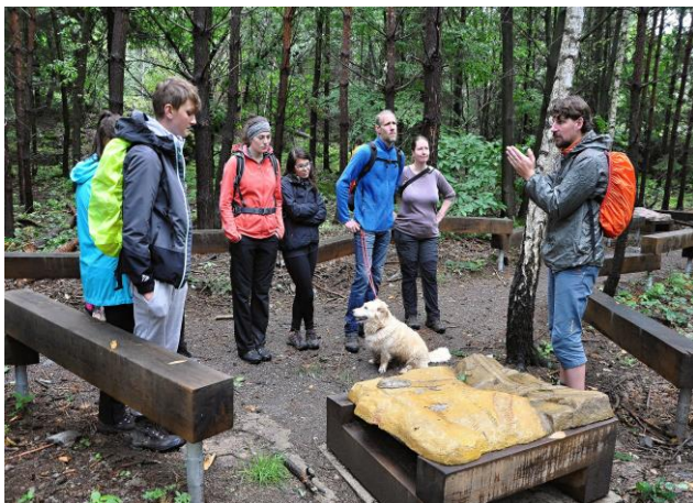
Geologická vycházka, 21. 6. 2020