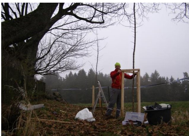
Výsadba nových javorů klenů na Lipce. 30. 11. 2020.