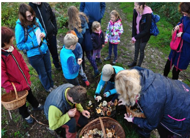
Mykologická vycházka do lesů na Podhůře, 10. 10. 2020