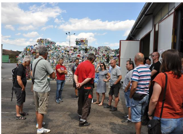
Odpady tour, návštěva třídící linky v Havlíčkově Brodu, 29.7. 2020.